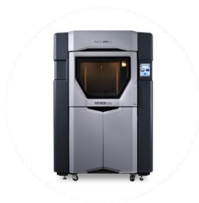
Figura 1. Fortus 450mc

Para la presente oferta se prestará el servicio de impresión 3D en tecnología FDM (Fused Deposition Modeling) con material Ultem 1010 utilizando la máquina Fortus 450mc